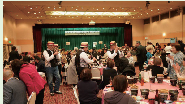
会員交流会の様子