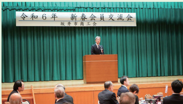
半澤会長による挨拶

アトラクションでは、坂井市出身のメンバーをもつジャズバンド『ディキシーハピネス』の演奏により会場内は盛り上がり、業種の垣根を越えた会員同士の絆を深める交流会となりました。